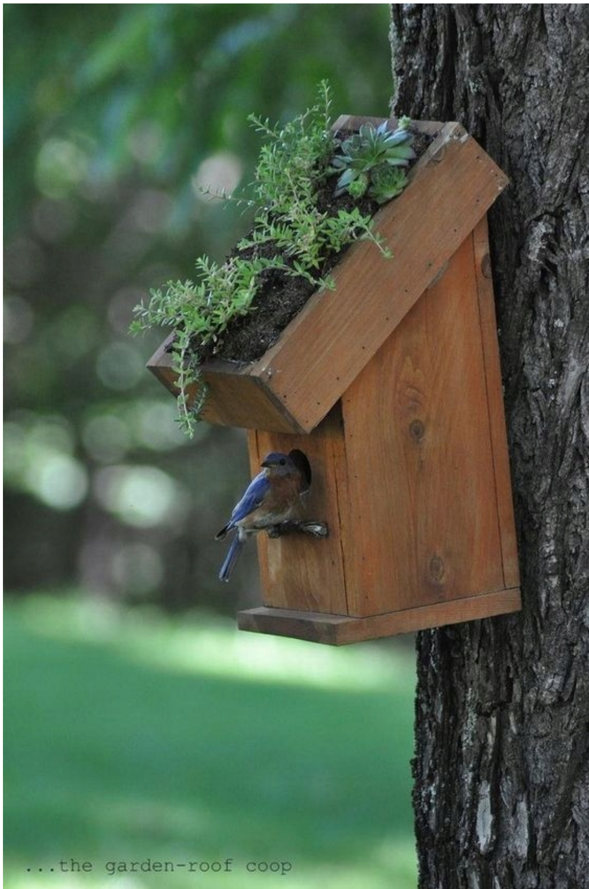
...the garden-roof coop