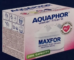
MAXFOR B25 Mg