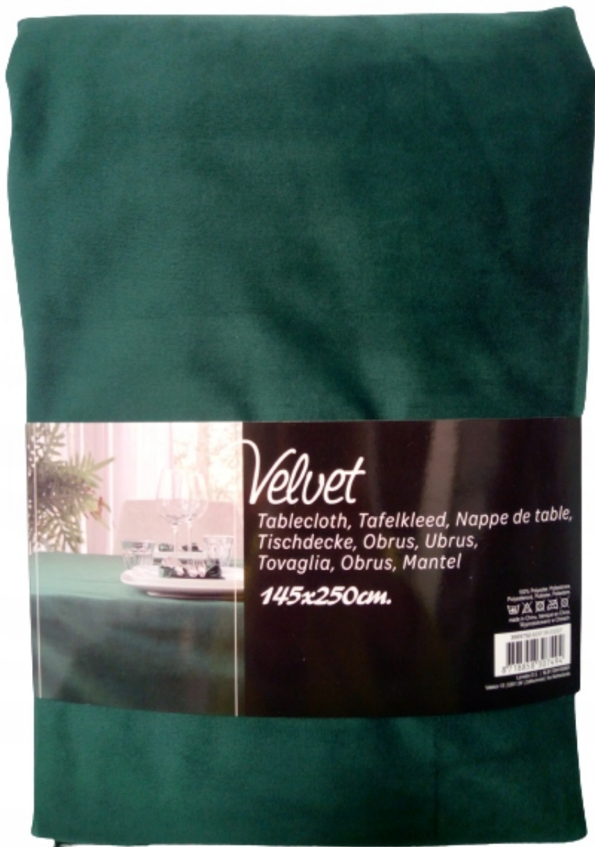
aksamitny w kolorze zielonym