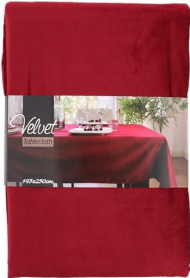
aksamitny w kolorze czerwonym