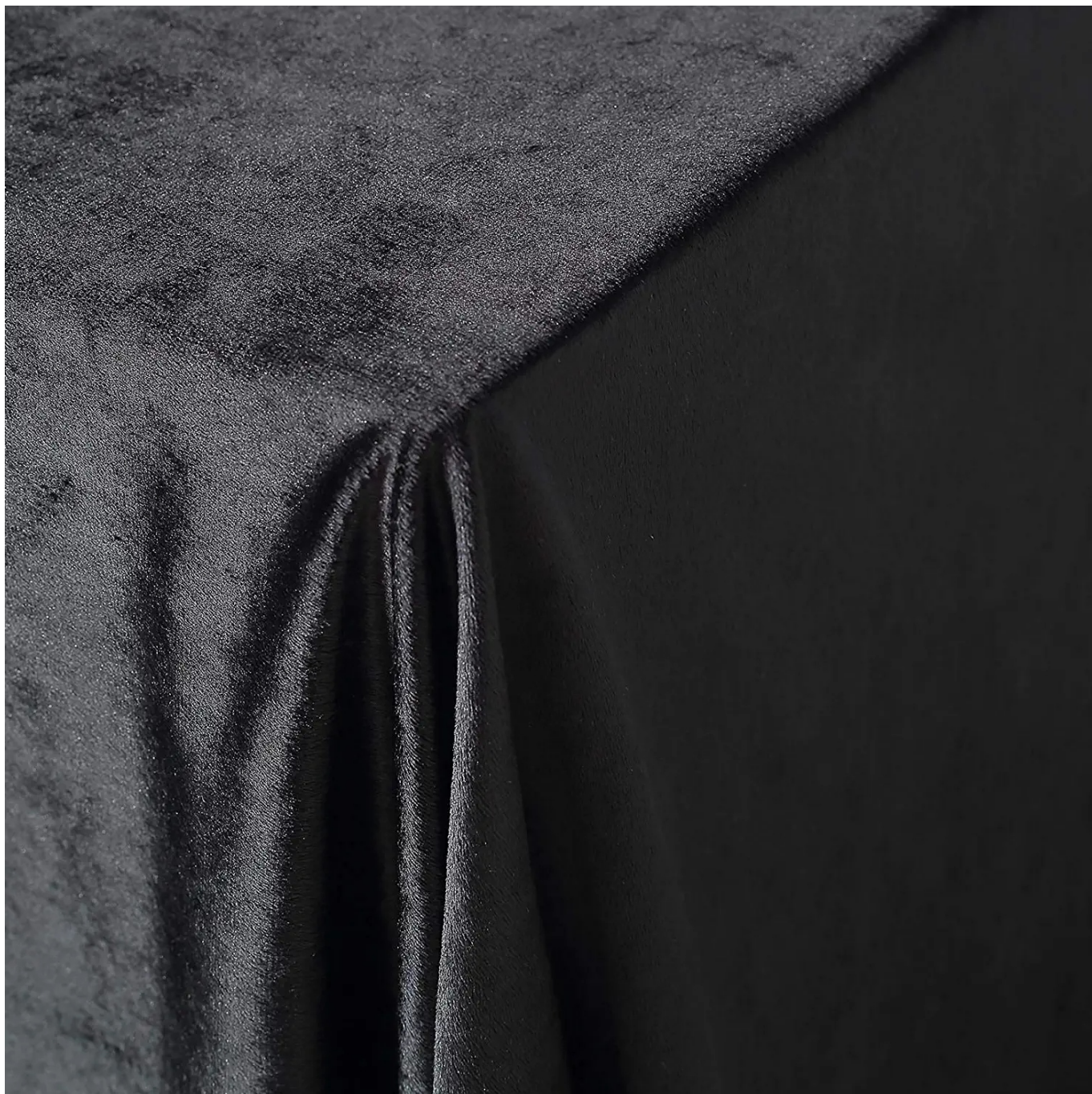
aksamitny w kolorze czarnym