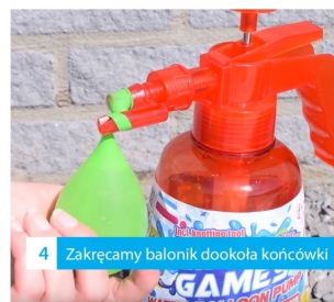
4 Zakrećamy balonik dookoła końcówki