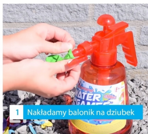
1 Nakładamy balonik na dziubek