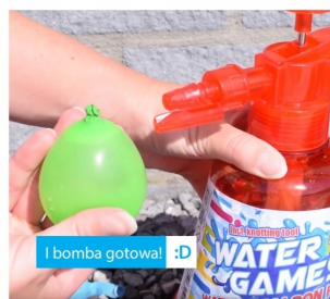
! bomba gotowa! :D