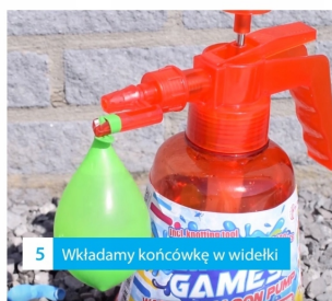
5 Wkładamy końcówkę w widelki