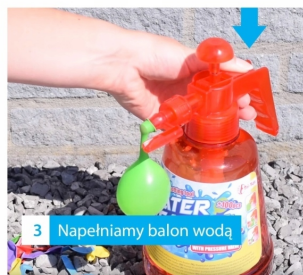
3 Napelniamy balon wodą