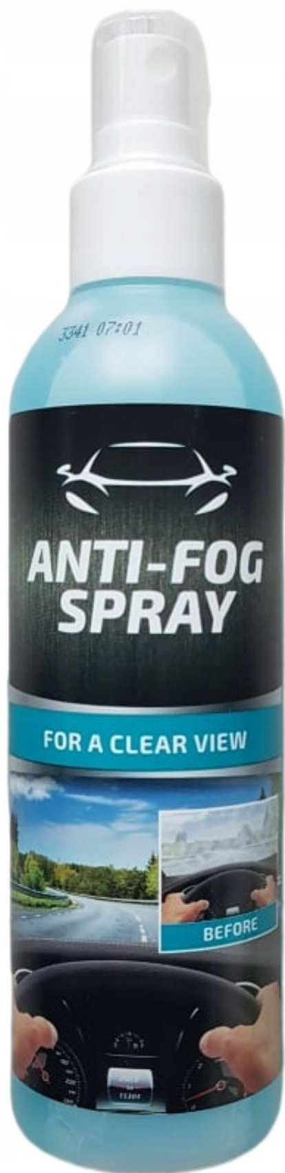
Preparat przeciw parowaniu szyb i luster Anty-Para 200 ml