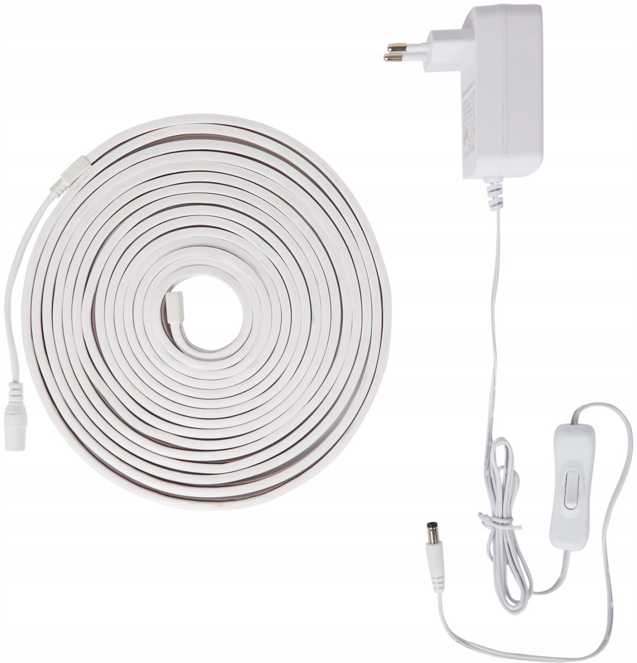
ZESTAW Z ZASILACZEM 24V