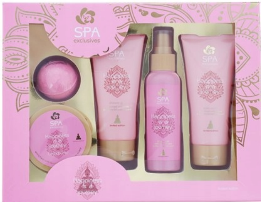
Zestaw Podarunkowy z kosmetykami do kąpieli