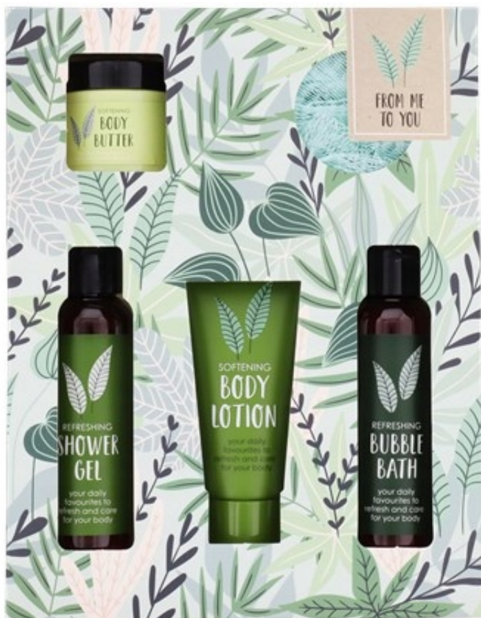
Zestaw upominkowy Velvet Beauty