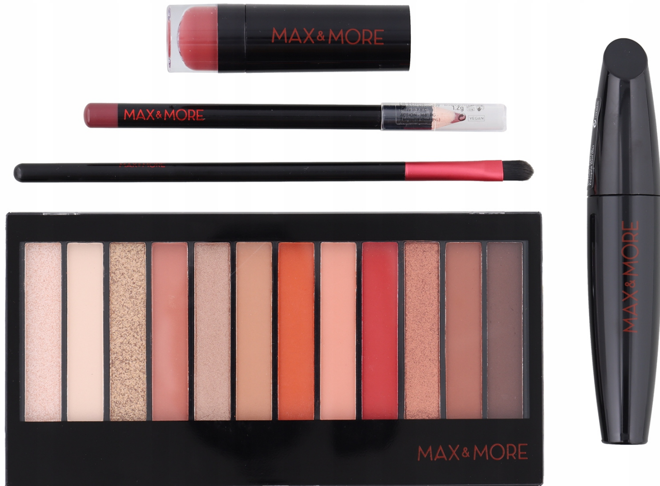
Zestaw Kaily Beauty Studio