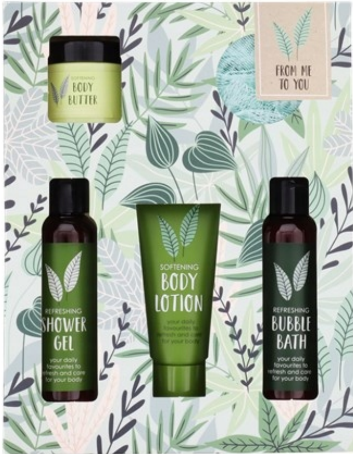
Zestaw upominkowy Velvet Beauty