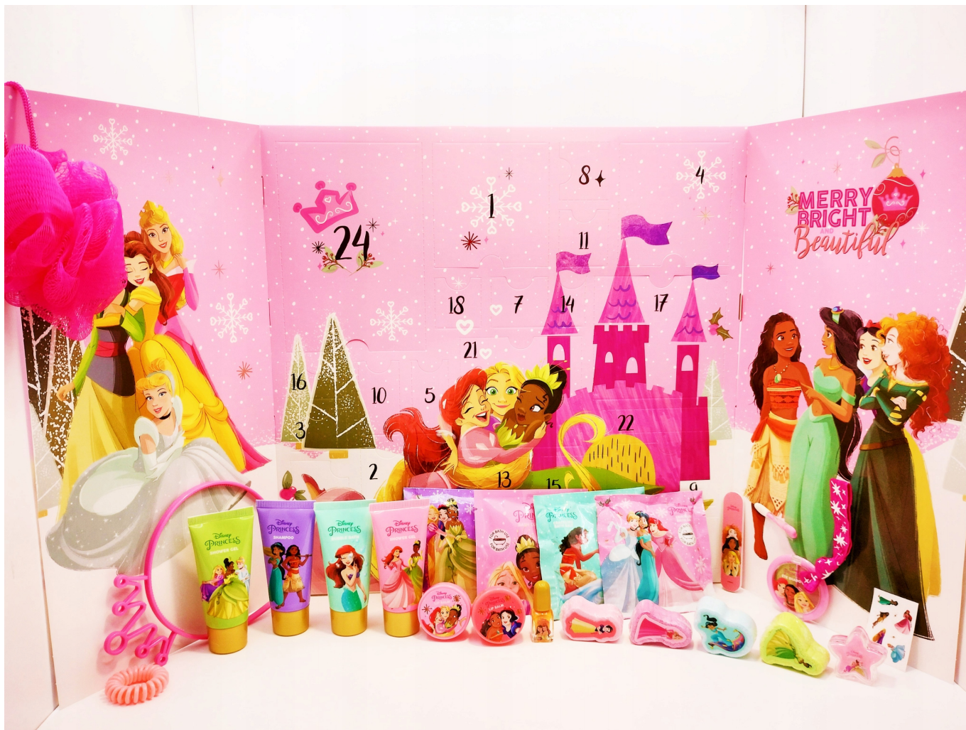
KALENDARZ ADWENTOWY Z KULAMI DO KĄPIELI